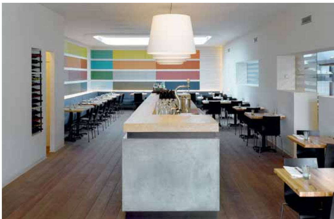
FOTO RECHTS Wand met kleurvlakken in restaurant Vandemarkt

FOTO LINKS Interieur artsenpraktijk Den Haag